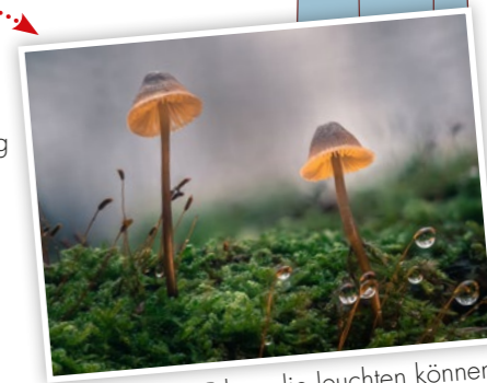
Es gibt sogar Pilze, die leuchten können! (Das Foto dient nur der Illustration)